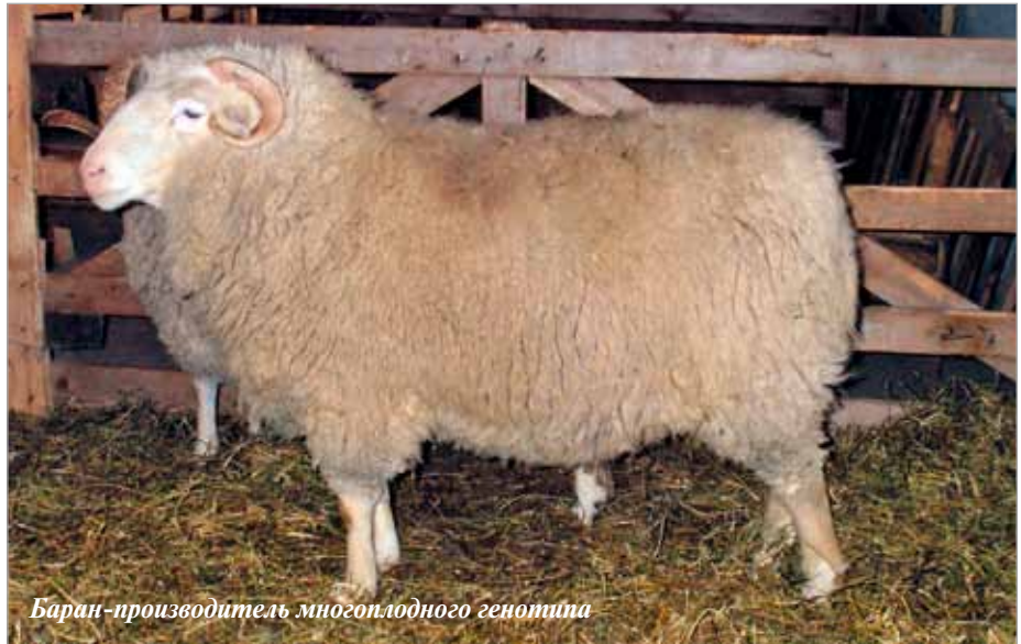
Баран-производитель многоплодного генотипа

Многолетний опыт подтверждает, что до отлучения от матерей ягнята растут хорошо, среднесуточные привесы редко бывают ниже 180–200 г. Но после