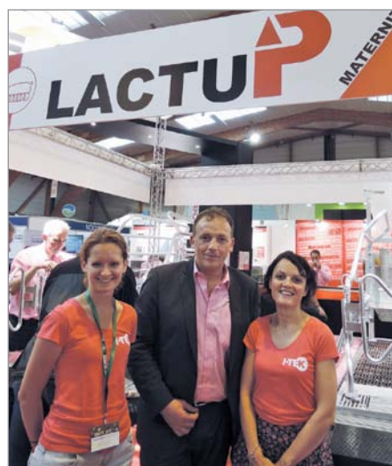
Оборудование I-ТЕК по достоинству оценили свиноводы во Франции и за ее пределами

информацию, консультации специалистов отрасли, обменяться опытом, обсудить насущные вопросы (раздача кормов, оборудование доильного зала,