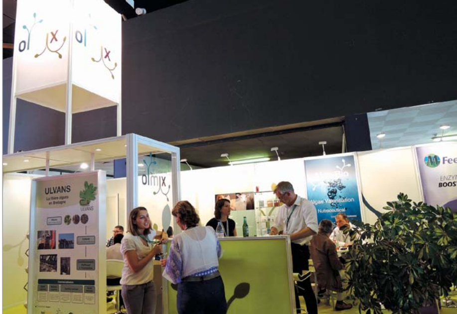
Французская компания Olmix давно работает в России