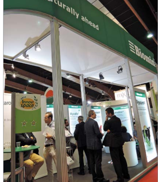
Фирма Biomix гордится тем, что завоевала «Две звезды» SPACE

начать; 14% отметили, что их торговый оборот на мировом рынке составляет 75% и более; 60% предприятий считают эту выставку эффективным инструментом для дальнейшего продвижения своих продуктов за рубеж.