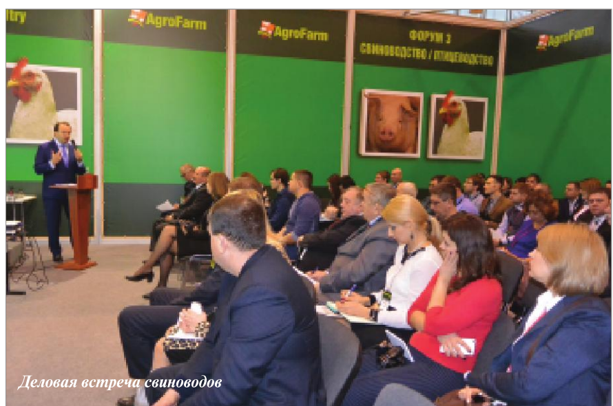
Деловая встреча свиноводов