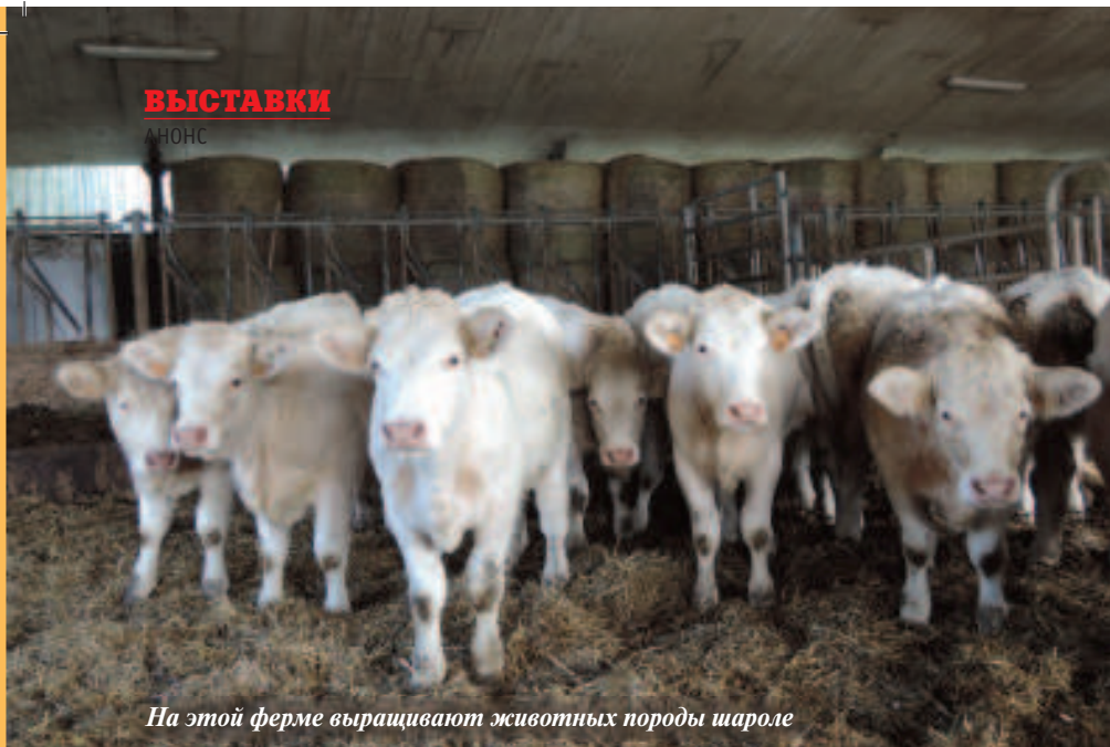
На этой ферме выращивают животных породы шароле