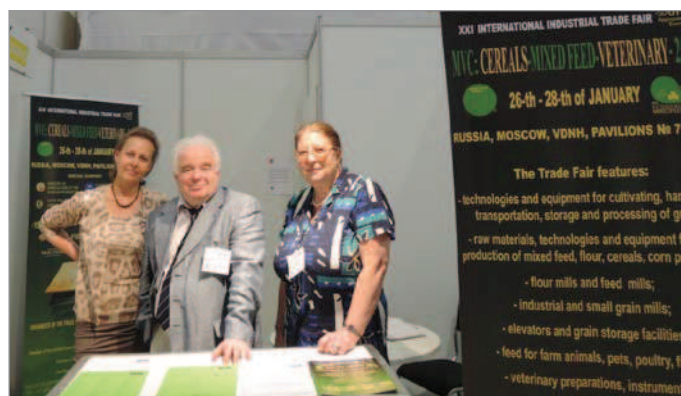
В январе «ЭкспоХлеб» ждет экспонентов на выставку в Москве

Постоянно растущая сложность подобного оборудования диктует необходимость работать только с самым современным софтом, который превращает бездушную машину в высокоспециализированный механизм. Оживить такого монстра — задача компаний, занимающихся автоматизацией линий. Они также были широко представлены на VICTAM.