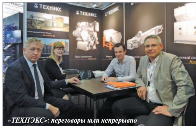
«ТЕХНЭКС»: переговоры шли непрерывно

мовой отрасли по нескольким программам. Ждем коллег из разных стран для обмена идеями. Можно дополнительно к обучению на Feed Design Lab организовать и посещение птицеводческих, свиноводческих и молочных ферм, где процессы производства механизированы, применяются передовые технологии.