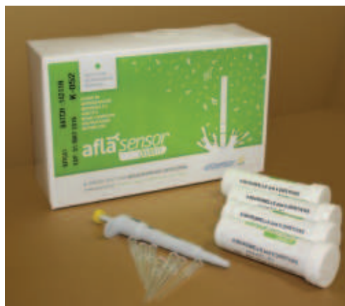
Рис. 2. Тест-набор для выявления афлатоксина М1 в пробах сырого и пастеризованного молока

МЕТОД ВЫЯВЛЕНИЯ АФЛАТОКСИНА М1 С ИСПОЛЬЗОВАНИЕМ ТЕСТ-НАБОРА AFLASENSOR M1 ВНЕСЕН В ПРОЕКТ ГОСТА «МОЛОКО И МОЛОЧНАЯ ПРОДУКЦИЯ. ЭКСПРЕСС-МЕТОД ОПРЕДЕЛЕНИЯ АФЛАТОКСИНА М1».