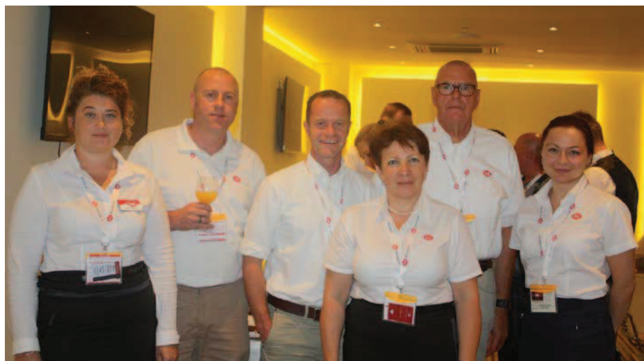
Технические специалисты Cobb