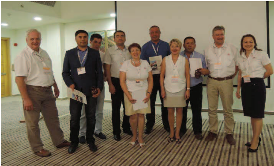
Представители птицефабрик Узбекистана после награждения