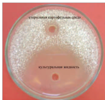
Рис. 2. Зона подавления роста гриба Fusarium graminearum штаммом бактерии Биотроф-600. Контроль — питательная среда без бактерий

Примечание. Н.п.д.о. — ниже предела достоверного определения методом ИФА.