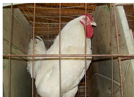
Фото 1. Дебикированный петух-производитель