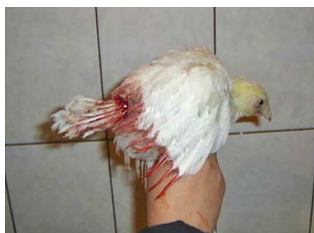
Фото 2. Расклев хвоста у 30-дневного интактного ремонтного петуха

рой — 2762 г, третьей — 2804 г, четвертой — 2799 г, пятой — 2757 г ( фото 1 ).