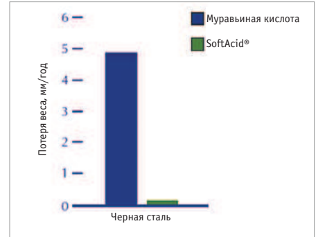
Рис. 1. Коррозионная стойкость железа (результаты получены в SINTEF, Норвегия, 2003)

Чтобы увеличить масштабы применения органических кислот в кормах, необходима улучшенная форма вещества — некоррозивная, безопасная, действенная и простая в применении. Животноводы, использующие органические кислоты, не должны делать выбор между безопасностью и эффективностью продукта.