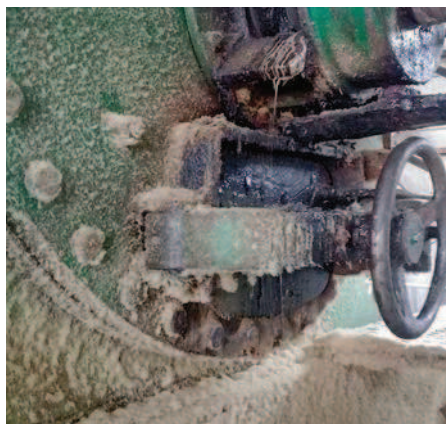
Фото 1. Жидкость, вытекающая из выгрузного клапана котла, — одна из причин перезаражения технологического оборудования и готовой продукции

жаются. Но в охладителях, на шнеках и других механизмах накапливается большое количество микробов. Это обусловлено тем, что при движении по шнеку продукт остывает и образуется конденсат. В условиях теплой и влажной среды бактерии интенсивно размножаются, а значит, риск перезаражения сырья возрастает.