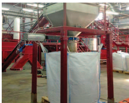
Фото 2. Использование одноразовой тары