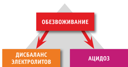
Рис. 2. Последствия обезвоживания организма

При сильной дегидратации (потеря свыше 8% жидкости), когда ворсинки кишечника повреждены и всасывание жизненно важных элементов нарушено, электролиты — глюкозу 5% (в до-