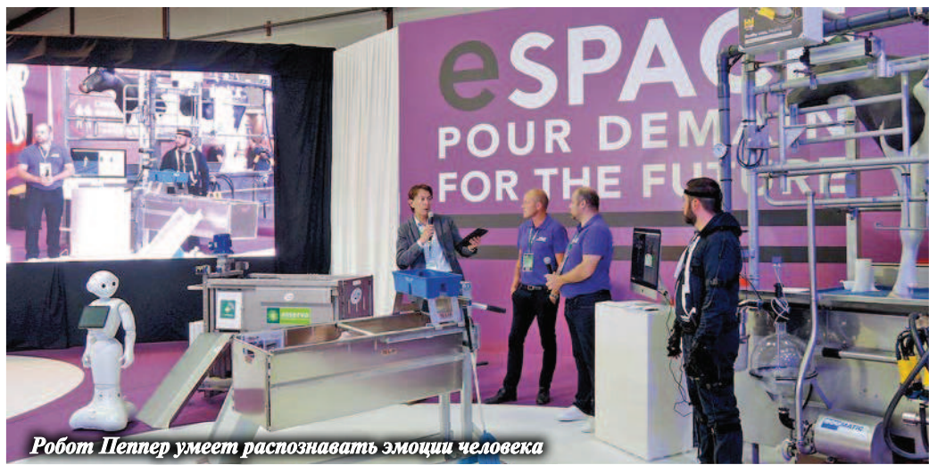
Робот Пенпер умеет распознавать эмоции человека