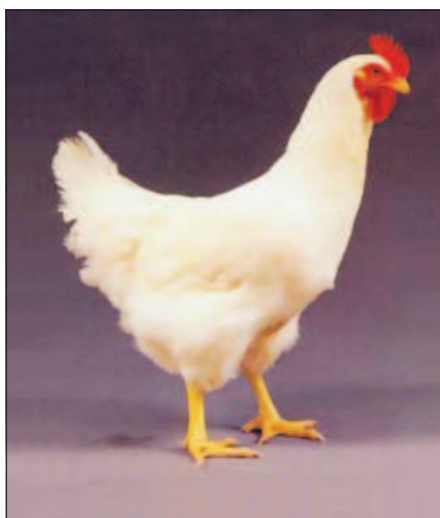
Фото 3. Кросс Hybro (слева петушок, справа курочка) — генетический материал фирмы Cobb-Vantress