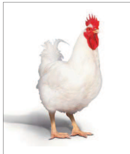
Фото 2. Кросс Hubbard — генетический материал фирмы Groupe Grimaud