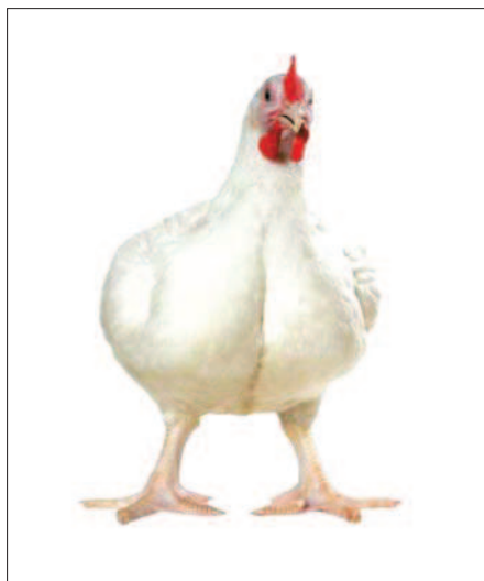
Фото 1. Кросс Indian River — генетический материал фирмы Aviagen

Срок достижения товарной готовности — не менее 81 суток, при этом цыпленок должен набрать массу не ниже 2,2 кг (рисунок). Программа Label Rouge успешно работает на протяжении нескольких лет, и генетические компании разрабатывают и предлагают птицеводам новые кроссы, пригод-