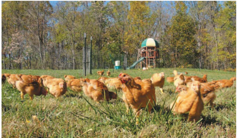
Фото 4. Выгульное выращивание бройлеров по системе Label Rouge

Самые известные производители генетического материала цыплят с замедленным ростом — европейские