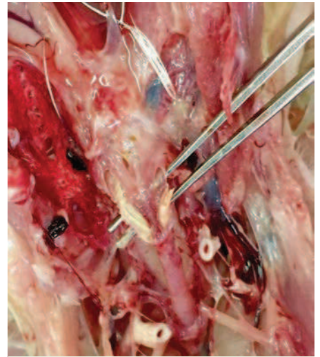
Фото 2. Фибринозная пробка в трахее

Часто инфекционный бронхит кур и пневмовирусная инфекция влияют на птицу одновременно, что приводит