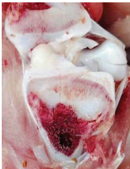
Фото 4. Хрящевая ткань не переходит в костную