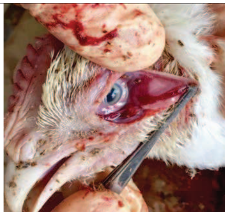
Фото 1. Конъюнктивит