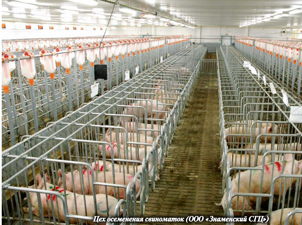
Цех осеменения свиноматок (ООО «Знаменский СПЦ»)

Наиболее эффективно работают молочные предприятия — ЗАО «Славянское», ООО Юпитер», АО «Картофельная нива Орловщины», ООО «Речица», колхоз «50 лет Октября», ОАО «Агрофирма Мценская», АО «Племенной завод им. А.С. Георгиевского», АО «Племзавод «Сергиевский», опытная станция «Стрелецкая» и др.