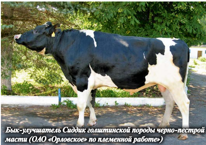
Бык-улучшитель Сиддик голштинской породы черно-пестрой масти (ОАО «Орловское» по племенной работе)

Средства из федерального и регионального бюджетов выделяются в форме субсидий для оказания несвязанной поддержки в области растениеводства и для повышения продуктивности в молочном скотоводстве (для содействия достижению целевых показателей региональных программ), для поддержания племенного животноводства, для агрострахования в сфере животноводства и растениеводства, а также для элитного семеноводства, для закладки многолетних насаждений и ухода за ними.