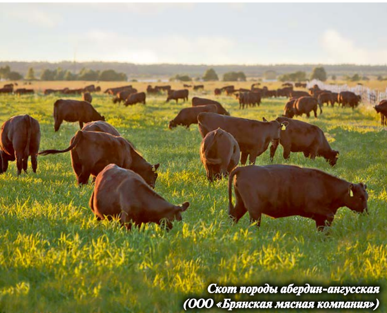
Скот породы абердин-ангусская (ООО «Брянская мясная компания»)