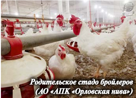
Родительское стадо бройлеров (АО «АПК «Орловская нива»)