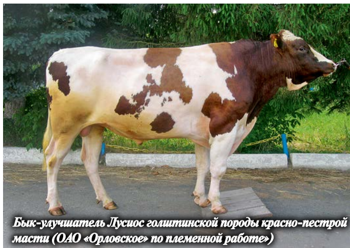
Бык-улучшитель Лусиос голштинской породы красно-пестрой масти (ОАО «Орловское» по племенной работе)

К 2020 г. в трех районах Орловской области Знаменский СГЦ построит три свинокомплекса для выращивания свиней F 1 мощностью 5 тыс. голов основных свиноматок каждый, комбикормовый завод мощностью 40 т в час, линию по производству престартерных кормов мощностью 10 т в час, а также объекты, которые войдут в состав цеха по убою свиней (холодильный цех мощностью 560 т, цех готовой продукции, очистные сооружения, участок технических фабрикатов мощностью 15 т в сутки).