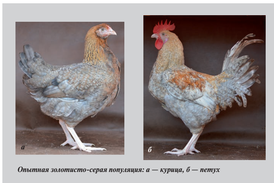
Опытная золотисто-серая популяция: а — курица, б — петух

При создании опытной ситцевой популяции использовали птицу пород нью-гемпшир, австралорп черно-пестрый, полтавская глинистая. Во втором поколении появились куры с ситцевым оперением. Перо — трехцветное, палевого окраса, с черной поперечной полосой и белым кончиком. Такой тип окраски — результат взаимодействия