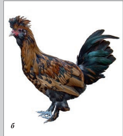
Воссозданная павловская порода: а — курица, б — петух

пили к созданию новой декоративной породы кур, фенотипически похожей на исчезнувшую отечественную павловскую породу. Для этого изучили данные выставок 1881, 1897, 1904 и 1906 гг., исследовали иллюстрации и сохранившиеся чучела, а также нашли сведения о генотипе, опубликованные А.С. Серебровским. К 2012 г. работу в основном завершили, а в 2016 г., после генетической проверки наследуемости и устойчивости порообразующих признаков, утвердили в качестве новой декоративной породы кур.