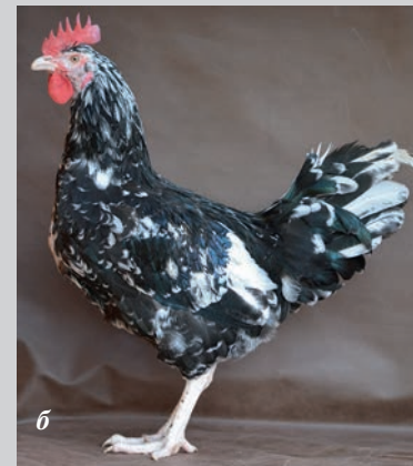
Австралорп черно-пестрый: а — курица, б — петух