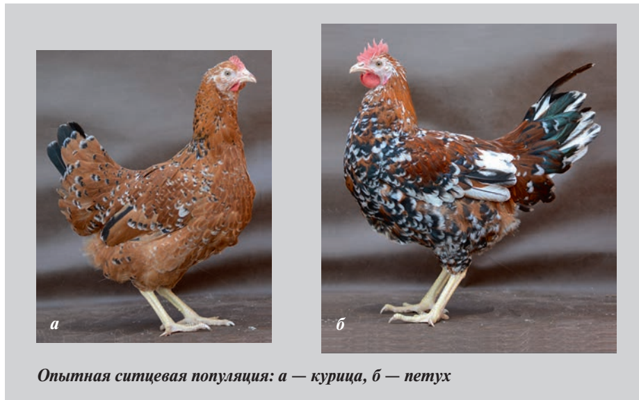
Опытная ситцевая популяция: а — курица, б — петух

Например, австралорп черно-пестрый — экспериментальная популяция кур мясо-яичного направления продуктивности. Она появилась в результате внутримышечного введения черным австралорпам крови полосатых плимут-