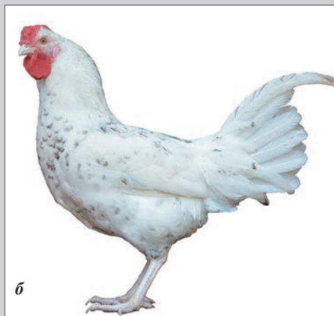
Пушкинская порода: а — курица, б — петух