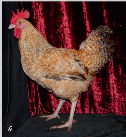
Опытная палевая бело-полосатая популяция: а — курица, б — петух

В обеспечении продовольственной безопасности нашей страны ведущую роль отводят мясному и яичному птицеводству. В России отрасль почти полностью представлена импортными кроссами, вследствие чего себестоимость продукции растет. Это объясняется тем, что цена племенного материала напрямую зависит от курса валют.