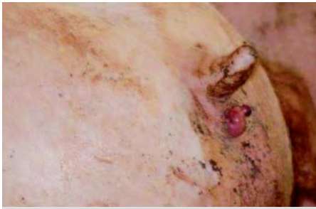
Фото 1. Выпадение прямой кишки при отравлении зеараленоном (Мальманн К., Дилькин П.)