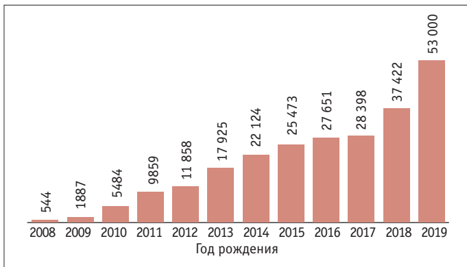
Рис. 2. Количество генотипированных особей женского пола голштинской породы, родившихся в Канаде в разные годы