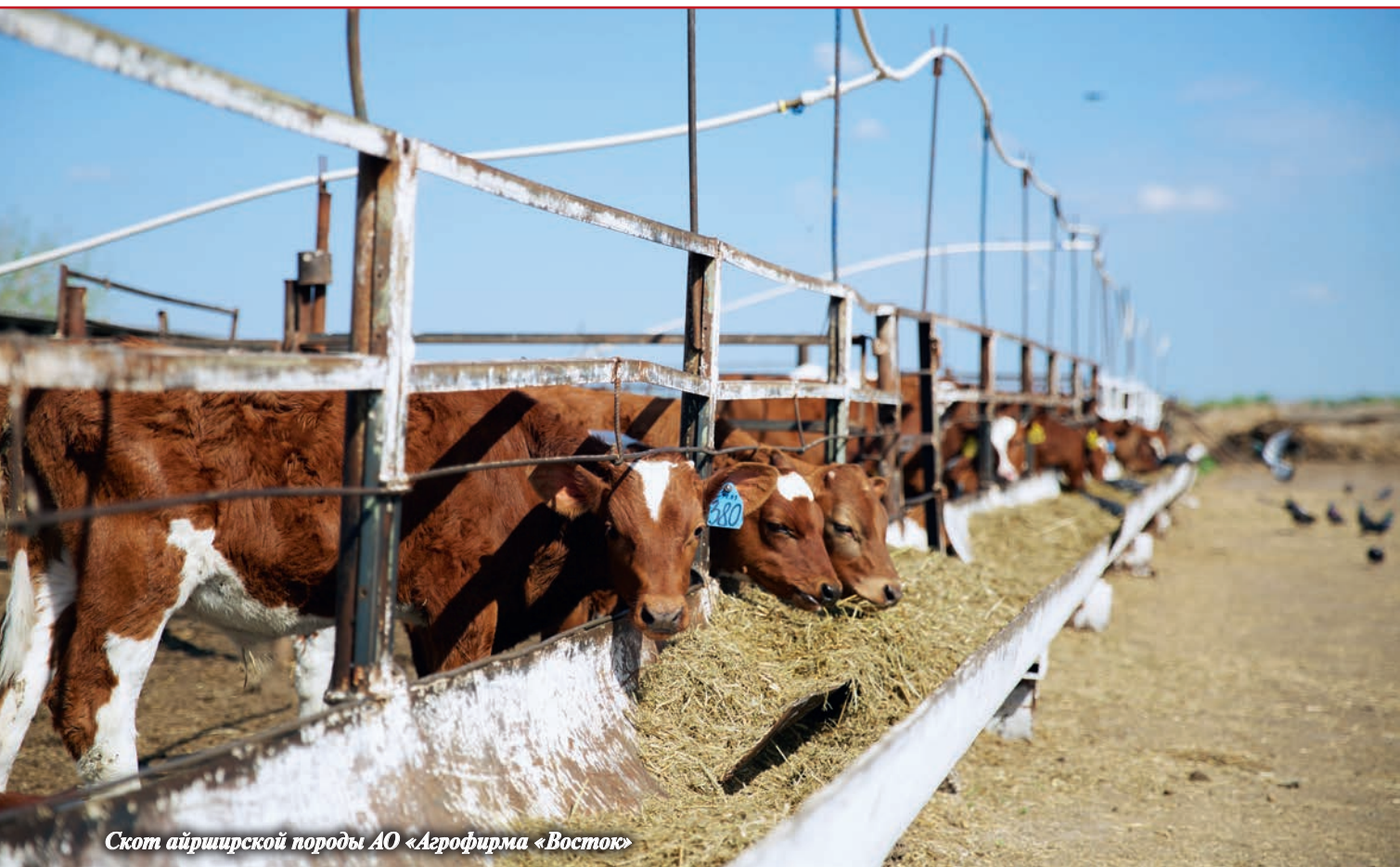
Скот айрширской породы АО «Агрофирма «Восток»