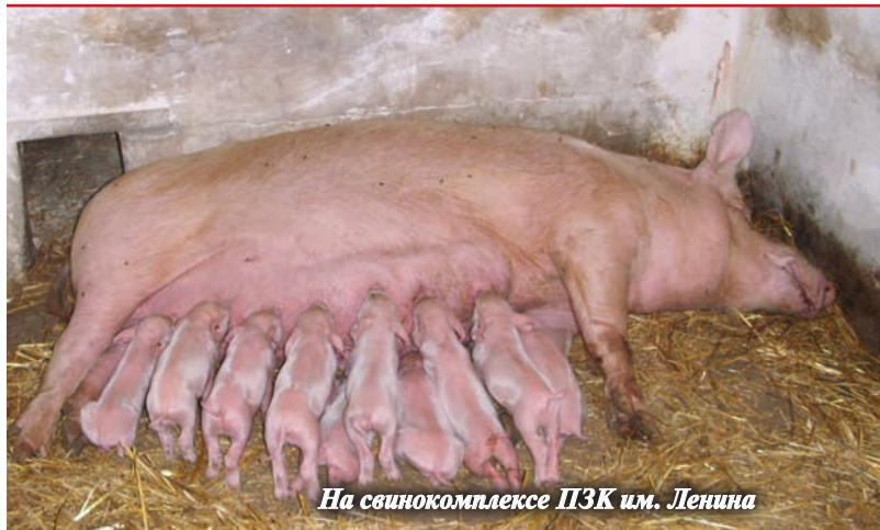
На свиномкомплексе ПЗК им. Ленина

— Кормопроизводство, как известно, — основа животноводства. Вопросы качественной заготовки кормов всегда в центре нашего внимания. В регионе активно развивается система мелиорации. В 2019 г. мы расширили площадь орошения более чем на 50% по сравнению с показателем 2014 г. Она составила 58,5 тыс. га, а к 2021 г. достигнет 67,1 тыс. га. Среднегодовой объем господдержки