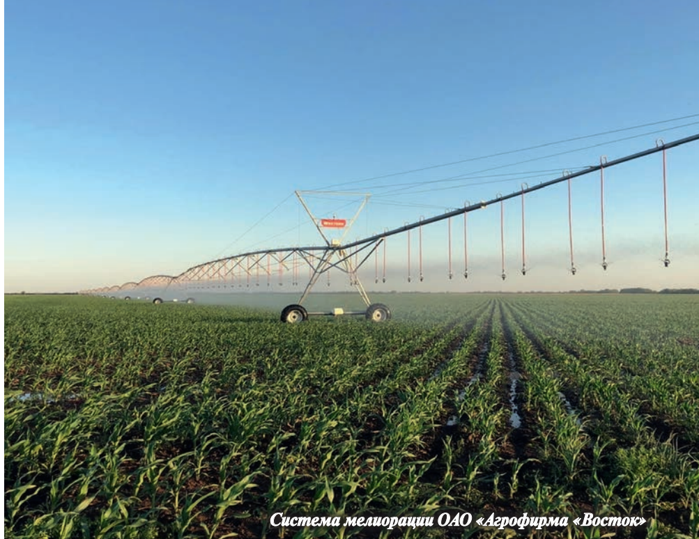
Система мелиорации ОАО «Агрофирма «Восток»

(на 2,3% больше, чем в аналогичный период 2019 г.). К концу июня 2020 г. численность свиней в сельхозорганизациях увеличилась на 3,7% по сравнению с показателем за соответствующий период 2019 г.