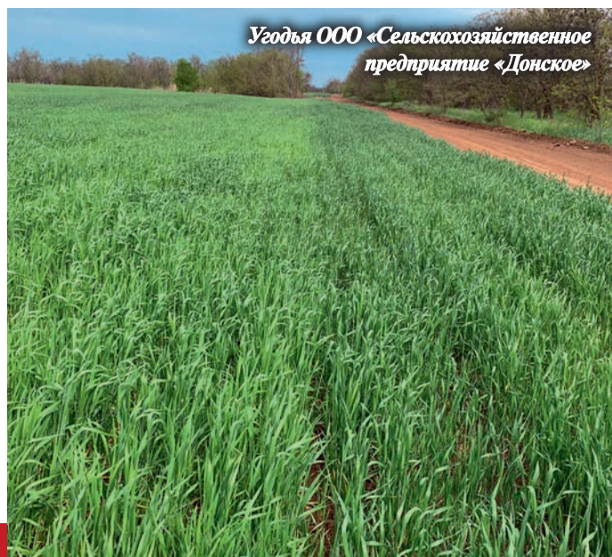
Угодья ООО «Сельскохозяйственное предприятие «Донское»

Как подтверждает этот пример, к решению задач развития АПК мы подходим комплексно. Параллельно с возведением мощных животноводческих предприятий работаем над вопросом их обеспечения кормами собственного про-