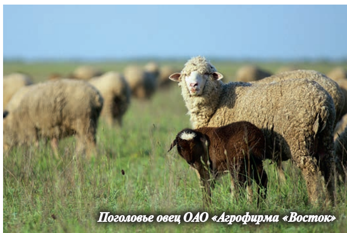
Поголовье овец ОАО «Агрофирма «Восток»