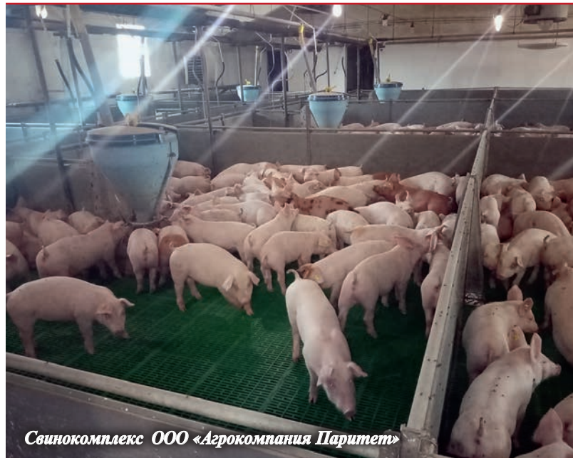
Свинокомплекс ООО «Агрокомпания Паритет»

Успешно развиваются и другие крупные предприятия, выпускающие продукты под известными в стране брендами. ООО «Кухмастер», ООО «СП Дядя Ваня — Девелей» и другие компании создают современные производства пол-