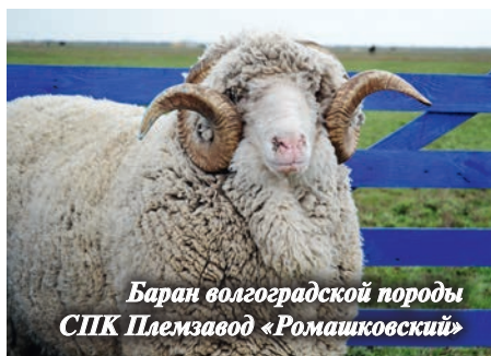
Баран волгоградской породы СПК Племзавод «Ромашковский»