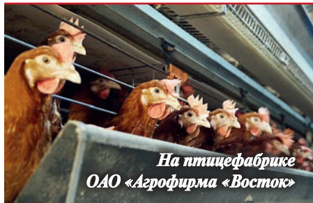
На птицефабрике ОАО «Агрофирма «Восток»