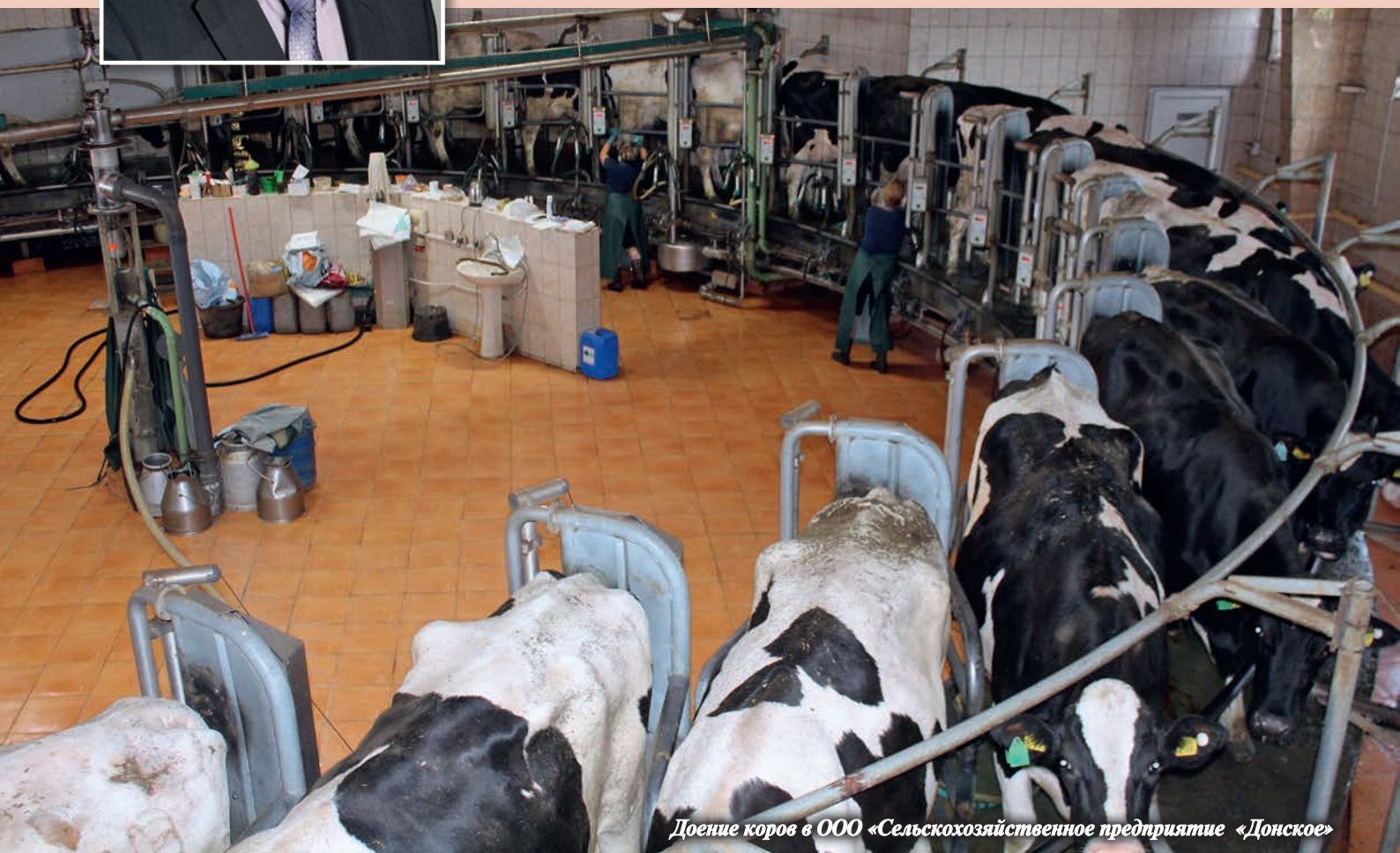
Доение коров в ООО «Сельскохозяйственное предприятие «Донское»