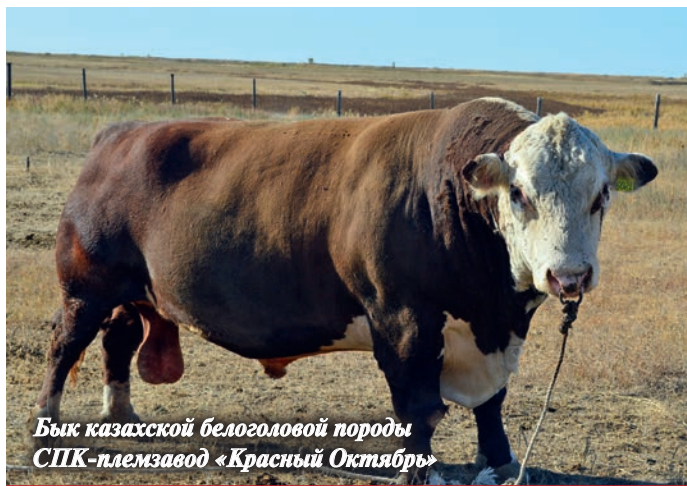
Бык казахской белоголовой породы СПК-племзавод «Красный Октябрь»

Местные сельхозпроизводители готовы расширить ассортимент поставляемой на экспорт продукции молочного