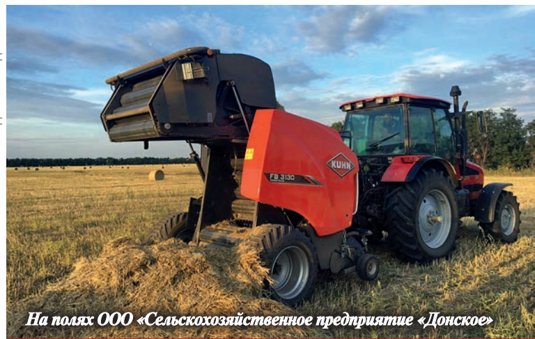
На полях ООО «Сельскохозяйственное предприятие «Донское»