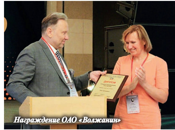
Награждение ОАО «Волжанин»