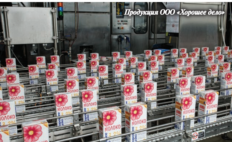
Продукция ООО «Хорошее дело»

— В 2021 г. сельхозорганизации республики приобрели 765 единиц техники на сумму 3850 млн руб., в том числе 128 тракторов, 53 зерноуборочных и 10 кормоуборочных комбайнов.