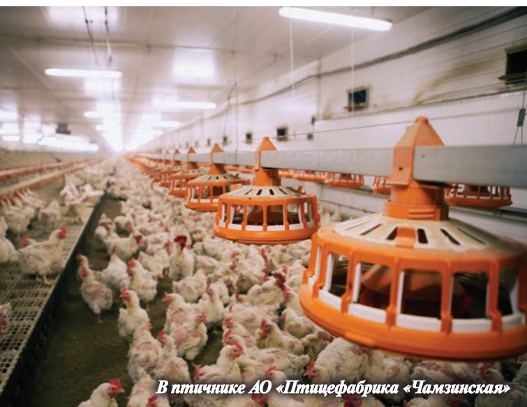
В птичнике АО «Птицефабрика «Чамзинская»

Объем господдержки производителей за девять месяцев 2021 г. составил 1779,8 млн руб., в том числе из федерального бюджета выделено 1453 млн руб., из регионального —