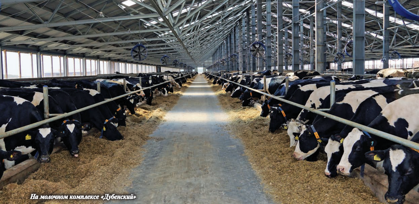
На молочном комплексе «Дубенский»

326,8 млн руб. Аграрии получали субсидии на 1 га посевной площади, на 1 кг реализованного молока, на выращивание племенных животных, содержание маточного поголовья мясного скота, страхование, элитное семеноводство, развитие мелиорации земель и др.