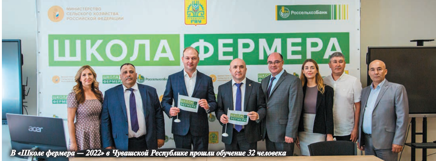
В «Школе фермера — 2022» в Чувашской Республике прошли обучение 32 человека

овец и (или) коз старше одного года (500 руб./гол.), на приобретение коров (нетелей) (70 тыс. руб./гол., но не более 99% стоимости), коз (5 тыс. руб./гол., но не более 99% стоимости), на покупку сельхозтехники и оборудования, товаров для пчеловодства (до 40% стоимости). Можно получить сразу несколько субсидий, лимит на одного человека — 500 тыс. руб. В сельских районах уже зарегистрировано более 9 тыс. самозанятых.