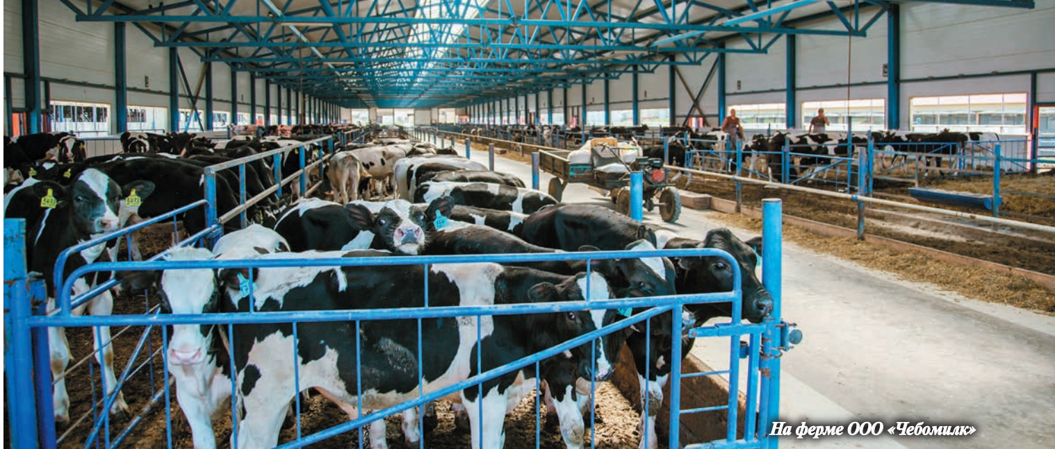
На ферме ООО «Чебомилак»

— Расскажите, пожалуйста, об использовании земель и о главных достижениях в растениеводстве.