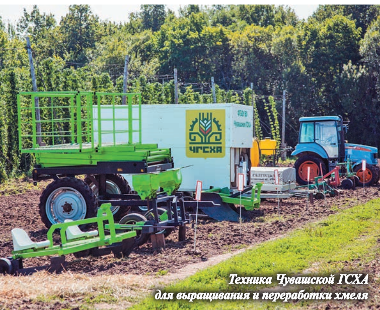
Техника Чувашской ГСХА для выращивания и переработки хмеля